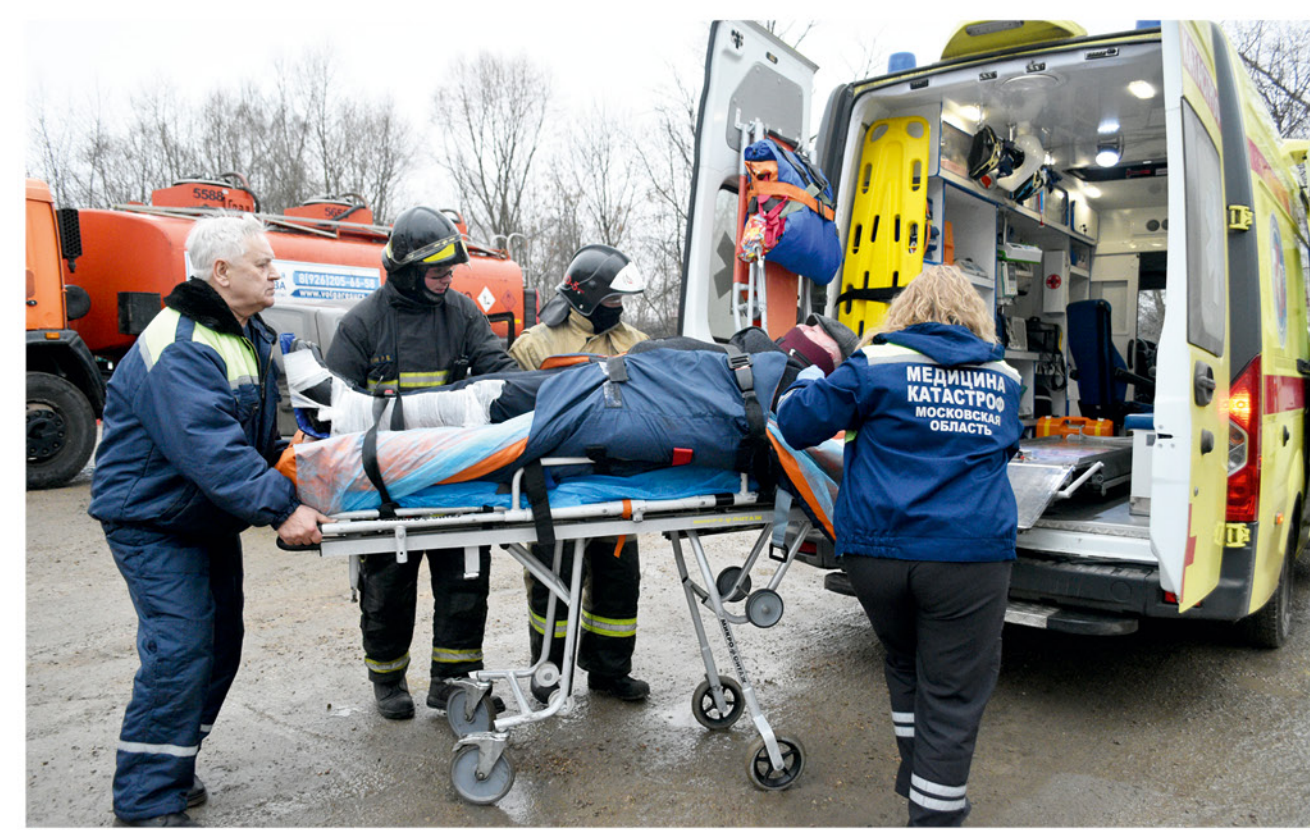
Специалисты аварийно-спасательной службы «Юпитер» постоянно отрабатывают свое мастерство на учениях, так как они прекрасно знают, что в реальных испытаниях счет идет на секунды.

возникновение чрезвычайных ситуаций. Конечно же, с развитием технологий растет и риск возникновения тех или иных аварий. Поэтому на уровне руководства муниципалитета принимается решение о закупке газоспасательного оборудования, а спасатели аварийно-спасательной службы прошли обучение в Новомосковском институте повышения квалификации, после чего уже в 2009-м году МУ АСС «Юпитер» было аттестовано как газоспасательное формирование. А в 2012-м году была начата программа модернизации и переоснащения отряда спасателей и ЕДДС города Серпухова. В течение пяти лет были выполнены мероприятия по приобретению и вводу в работу современного спасательного оборудования, средств управления и связи. С этого же года серпуховские спасатели ежегодно принимают участие в Международном салоне «Комплексная безопасность», представляя Московскую область.