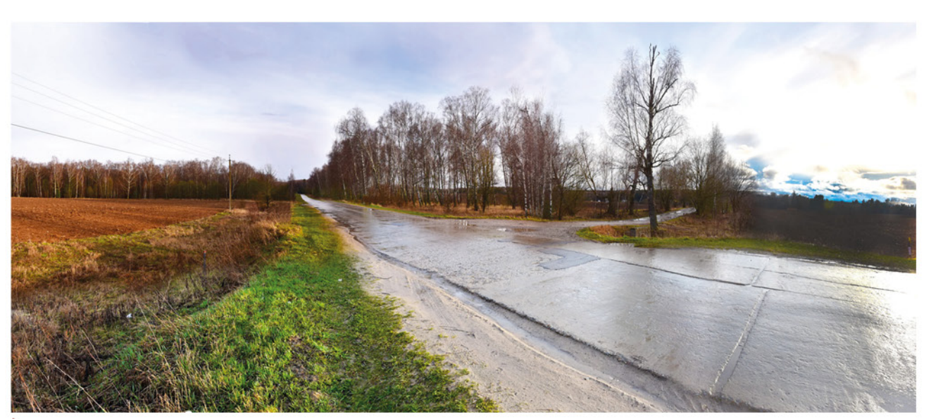
Панорама места боя.

49-я армия в середине октября 1941 года имела основную задачу — не допустить врага на дорогу Москва-Тула, а также удержать город Серпухов. В то же время упорные оборонительные бои 43-й армии не дали возможности противнику совершить обход Серпухова с севера. Каждый день, когда обороняющиеся войска 43-й и 49-й армий сдерживали противника на своих участках обороны, давал драгоценное время войскам Красной армии для организации надежной обороны на южных подступах к Москве.