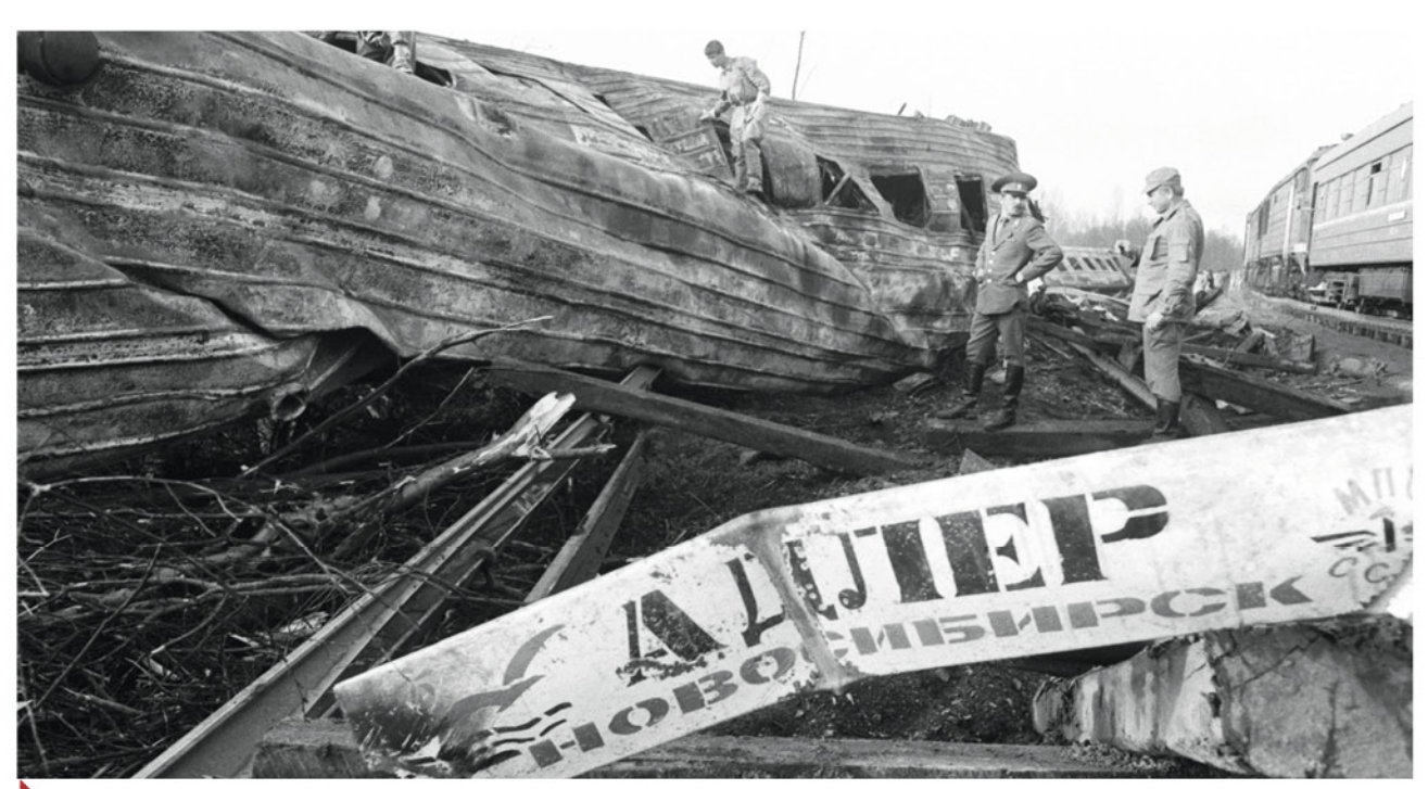
🕨 Авария произошла 4 июня 1989 года в 1:15 ночи.

егодня в МЧС России служат настоящие профессионалы своего дела, которые даже в самых сложных, казалось бы, самых безнадежных ситуациях оказывают людям помощь. Пожарные, спасатели, водолазы, кинологи, летчики и многие другие специалисты МЧС России в любой момент готовы прибыть на место происшествия, будь это даже техногенные или природные катастрофы.