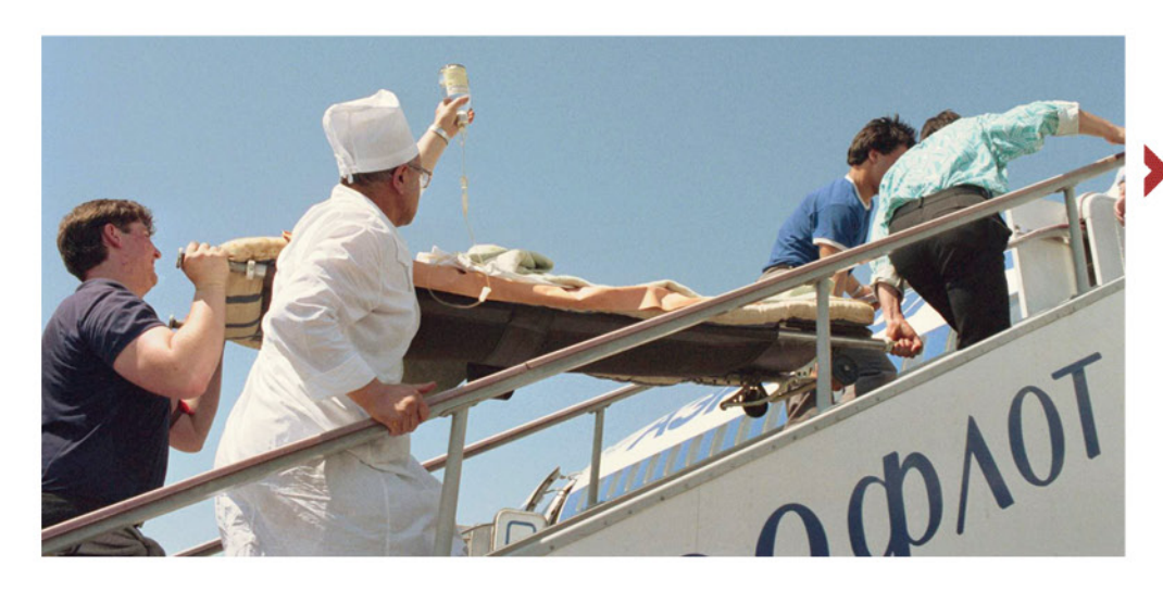
Пострадавшего перевозят из Уфы в больницу в Москве.

направить на место катастрофы специализированные бригады. Когда же поступила информация о масштабах трагедии, то пришлось направить туда 57 бригад, которые были тогда на линии, а их в Уфе было всего 64. Для города я оставил по одной бригаде на каждый район — то есть семь машин. В ту ночь у нас было зафиксировано 460 отказов по вызовам. Машины выезжали по самым неотложным вызовам, остальным давали рекомендации по телефону — что делать и куда обратиться. Самое сложное в такой обстановке — связь. Машины скорой работали тогда на радиостанциях в радиусе до 25-30 км. И с каждой подстанции была организована колонна с назначенным мной старшим. Первыми ушли головные машины, с интервалом 3-5 минут за ними следовали следующие скорые. Через эту цепь мы держали связь с головными машинами колонны. До Улу-Теляка 90 км, а мы удлинили радиус связи до очага катастрофы.